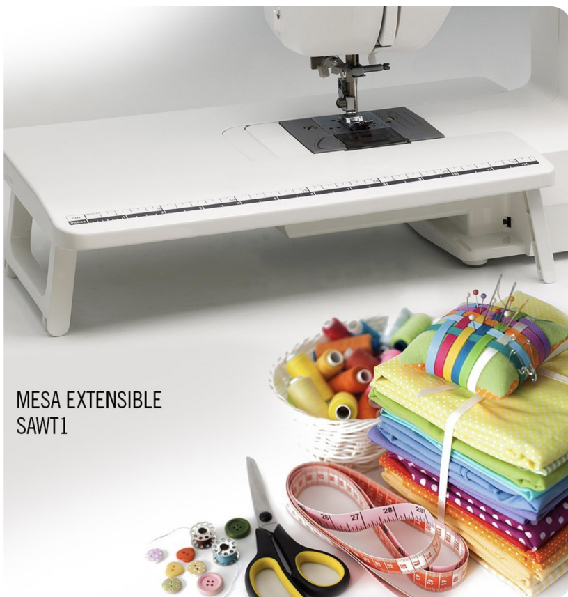
MESA EXTENSIBLE SAWT1